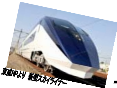
京成IPより 新型スカイラー